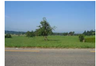
Blick von der Albisstrasse