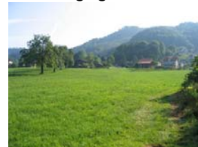
Blick nach Nordosten