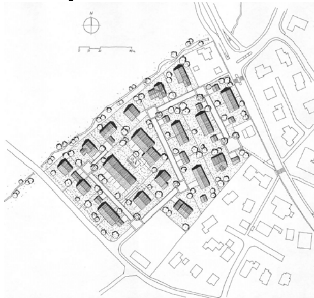
Mischbebauung mit Reihen-, Doppel- und Einfamilienhäusern