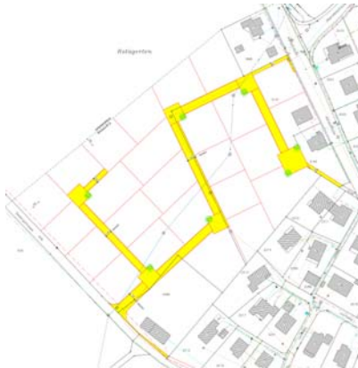
Erschliessung entlang der bestehenden Schmutzwasserleitung