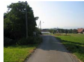
Seerigstrasse (Zubringer zum Quartier)