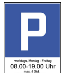
Parkzeitbeschränkung weiss markierte Parkfelder