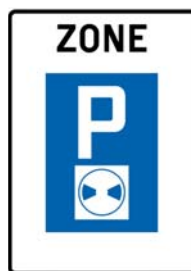
Blaue Zone ohne markierte Parkfelder