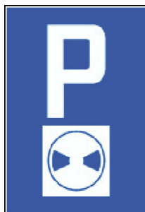
Blaue Zone mit markierten Parkfeldern