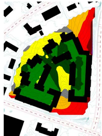
Bauen an lärmexponierter Lage