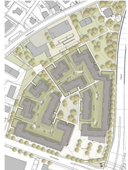
Situationsplan mit Dachaufsichten